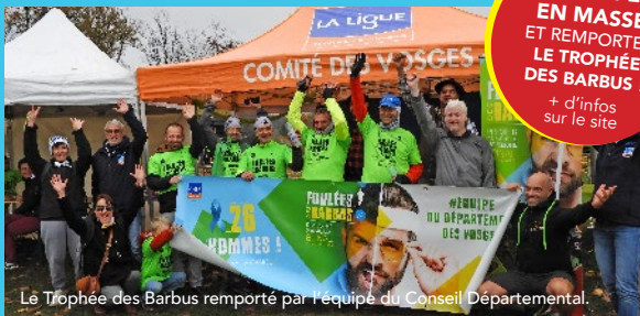
Le Trophée des Barbus remporté par l'équipe du Conseil Départemental.

PARTICIPEZ EN MASSE ET REMPORTEZ LE TROPHÉE DES BARBUS ! + d'infos sur le site